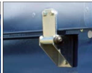
Stabiles Stahlscharnier für Metalldeckel / stable hinge belts for the metal cover