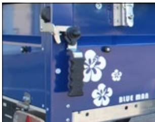
STEMA Sicherheitsverschluss (IMA getestet) / STEMA safety interlock (IMA proved)