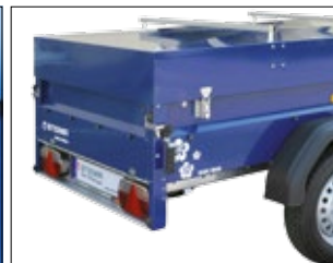
allseitig geschützte Multifunktionsleuchten / impact-protected multifunctional rear lights