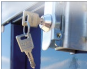
Metalldeckel mit 2 Sicherheitsschlössern / metal cover with 2 safety locks