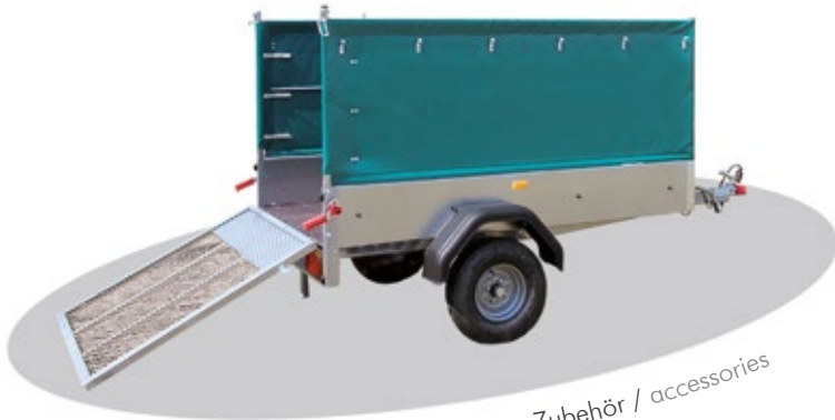
Zubehör / accessories