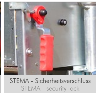
STEMA - Sicherheitsverschluss STEMA - security lock