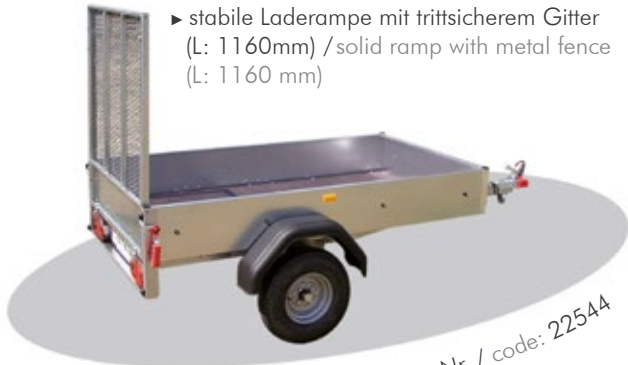
Basismodell / basic model Art.-Nr. / code: 22544