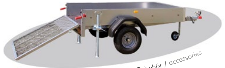
Zubehör / accessories