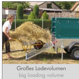
Großes Ladevolumen big loading volume