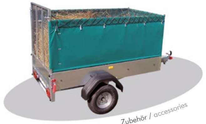
Zubehör / accessories

Änderungen behält sich die STEMA. Maße und Gewichte sind gerundet. Bilder sind Musterabbildungen und enthalten teilweise Zubehör. Nationale Ausführungen können abweichen. STEMA reserves the right to change any specifications. Measures and weight are approximations. Pictures are classic examples and partly contain accessories. National models can be different.